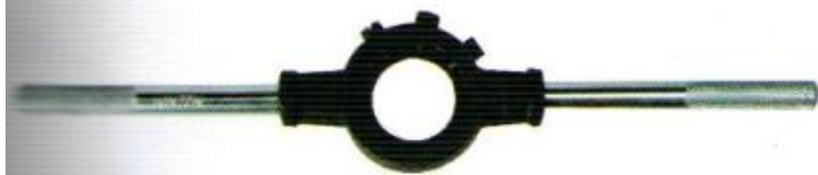
ด้ามลำปตัวเมีย WINTON (เหล็ก)