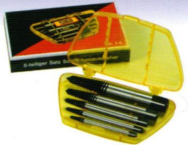
ลำปคอนเกลียวซ้าย TUBUS