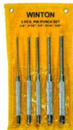
เหล็กส่งเตเปอร์ 5 ตัวชุด