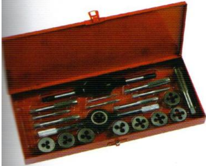
ลำปเกลียวชุด WINTON (กล่องเหล็ก) 21 ตัวชุด (ชุด มีa)