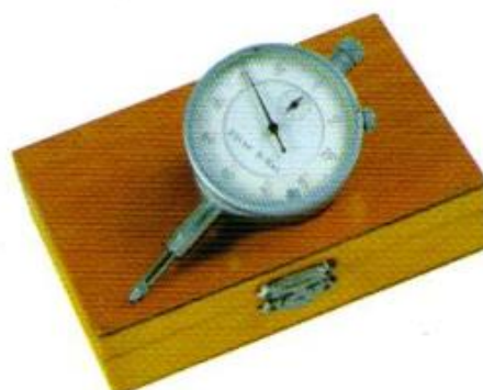
เกยตั้งศูนย์