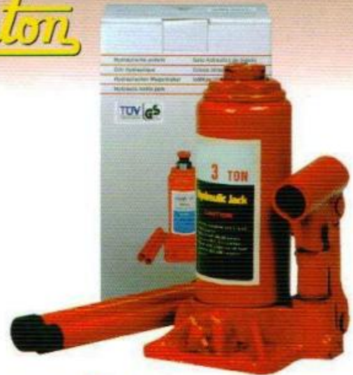
แม่แรงลม WINTON ไตหวัน

ขนาด 2 ตัน 3 ตัน 5 ตัน 10 ตัน 15 ตัน 20 ตัน 30 ตัน