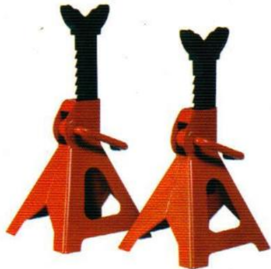
ขาตั้งรถยนต์ รุ่นงานหนัก 2 TON