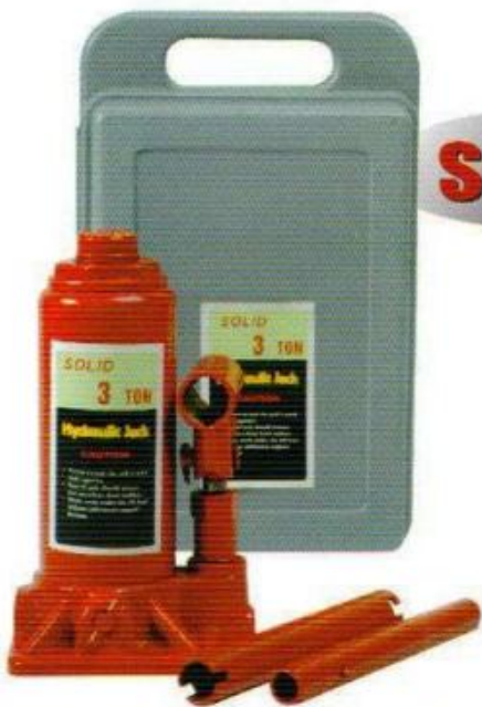
แม่แรงลม พร้อมกระเป๋า SOLID