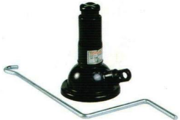
แม่แรงเกลียว 2 ตัน (เท้าช้าง) พร้อมด้าม