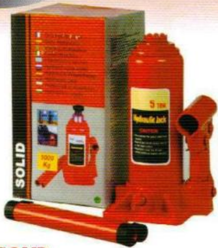
แม่แรงลม SOLID

ขนาด 2 ตัน 3 ตัน 5 ตัน 10 ตัน 15 ตัน 20 ตัน