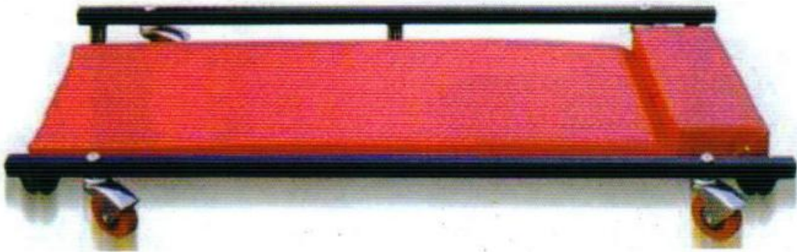
เตียงช่อมใต้ท้องรถ 36"