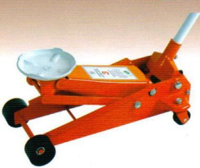
แม่แรงตะเบ้ 3 ตัน ( รุ่นงานหนัก )