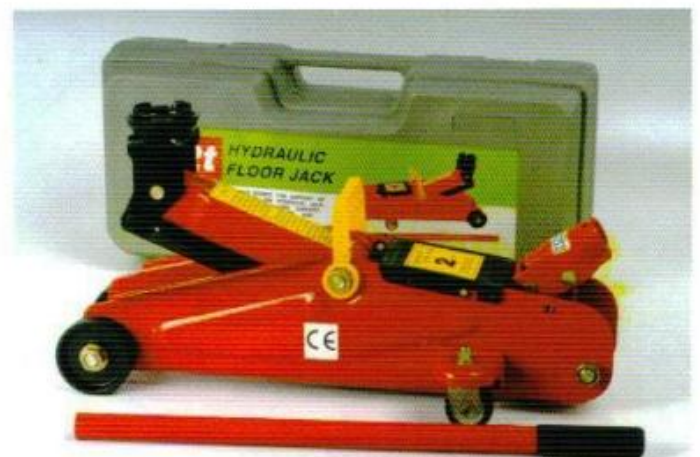
แม่แรงตะแับ พร้อมกระเป๋า 2 ตัน อย่างดี