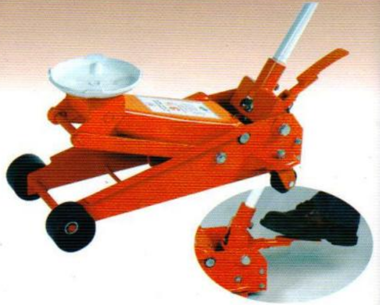
แม่แรงตะเบ้ 3.1/2 ตัน (รุ่นงานหนัก) มีเท้าหยีบ