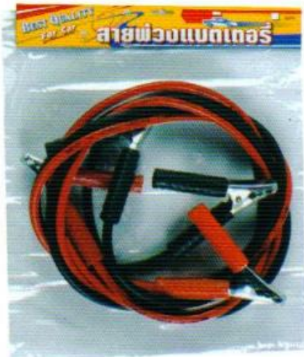
สายพ่วงแบตเตอรี่ อย่างดี 2 เมตร