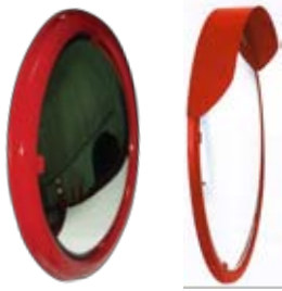
SNCM18G, SNCM24G กระจกโค้ง 18", 24"