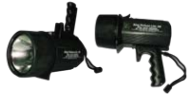
SEPL4000 ไฟฉายนิรภัย LASERPRO (8D) 100,000 แสงเทียน