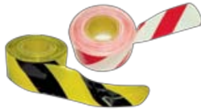
SNMT3500 แดง-ขาว SNMT3200 เหลือง-ดำ เทปกั้นเขตอันตราย