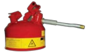
ถังนิรภัยเก็บน้ำมันและ สารเคมี JUSTRITLE