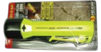
SEPL2000 ไฟฉายนิรภัยกันระเบิด PELICAN 2000C