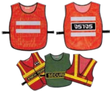
SNSP1001 เสื้อกั๊กสะท้อนแสง