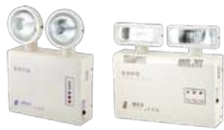
ไฟฉุกเฉิน