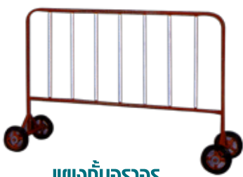
แผงกั้นจราจร