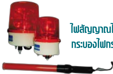
ไฟสัญญาณไซเรน กระบอกไฟกระพริบ