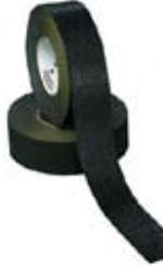
SN3M610BL เทปติดพื้นกันลื่น