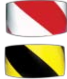
SNMT5704 (สีแดง-ขาว) SNMT5702 (สีเหลือง-ดำ) เทปติดพื้นสลับสี