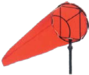
SNWS01 ทูบบอกทิศทางลม (ไม่รวมโครง)