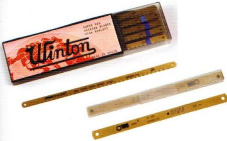
ใบเลื่อย HSS สี่ทอง WINTON **เกรดพิเศษ**