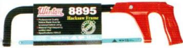
โครงเลื่อย WINTON รุ่น 8895