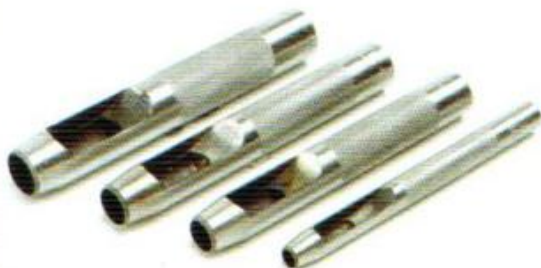
เหล็กปัดรู