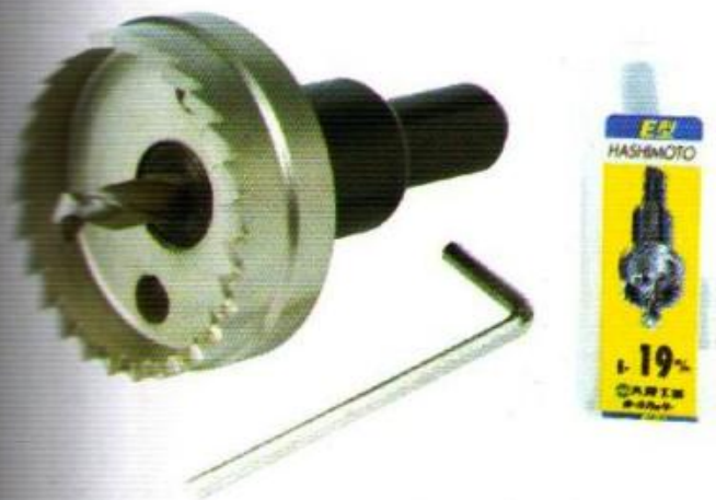
SUPER H.S.S. HOLE SAW CUTTER