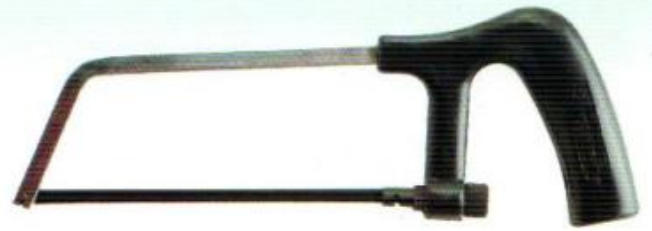
โครงเลื่อยเล็กด้ามพลาสติก