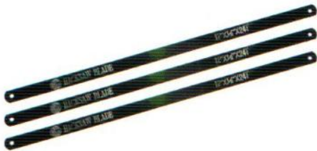
ใบเลื่อยสีน้ำเงิน ตราลูกโลก BCP (18 ฟัน, 24 ฟัน)