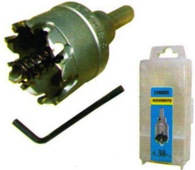
SUPER H.S.S. HOLE SAW CARBIDE